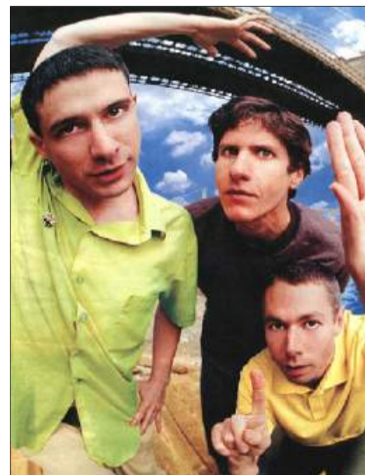
Weil keiner von ihnen singen konnte, mussten sie ihre Texte sprechen.

ten. Somit musste gesprochen werden, was die meist sexistischen oder gewaltstrotzenden Texte um-