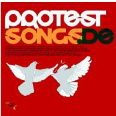
Eine CD mit Geschichte.

Natürlich kommt dieser Ritt durch die bundesdeutsche Geschichte nicht ohne Bands wie Tocotronic, Die Sterne oder Ton Steine Scherben und Songschreiber wie Udo Lindenberg, Funny van Dannen oder Hans Söllner aus. So weit, so erwartbar. Jedoch dürfen auch Sandow