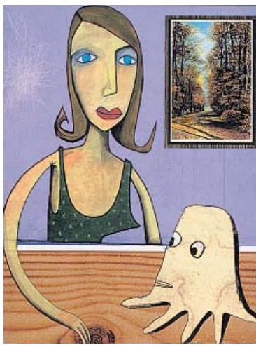
Jim Avignons 'Scratchbook'-Cover

Auch die reifer gewordene „Jugend musiziert“: Unter diesem Motto sind jedenfalls die künstlerischen Grenzgänger Neoangin und Nova Huta auf Tour. Am 18. November, 21 Uhr, gastieren sie im Musikclub „Rakete“ (Vogelweierstraße 64).